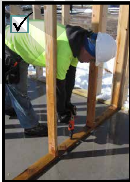
Only point the tool at the intended substrate. Sólo apuntar la herramienta hacia el objeto designado.