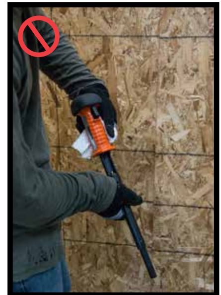
Do not perform maintenance on the tool if it is loaded. No hacer el mantenimiento a la herramienta si está cargada.