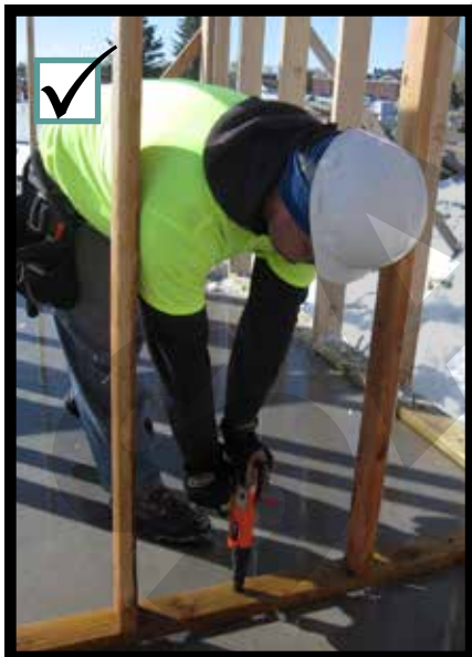
Keep hands and feet free of the firing zone. Mantener las manos y los pies fuera de la zona de disparar.