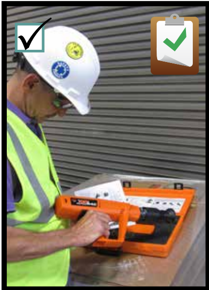
Inspect the tool before each use. Inspeccionar la herramienta antes de usar.