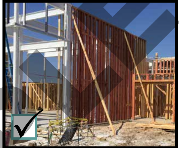
Brace walls. Amarrar las paredes .