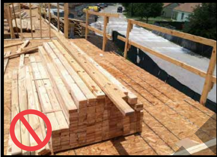
DO NOT leave piles of lumber unsecured for potential high winds. NO deje montones de madera sin asegurar por posibles vientos fuertes.

GENERAL JOBSITE SAFETY (Seguridad General del Area de Trabajo): High Wind - Securing the Jobsite (Vientos Fuertes - Asegurando el lugar de trabajo)